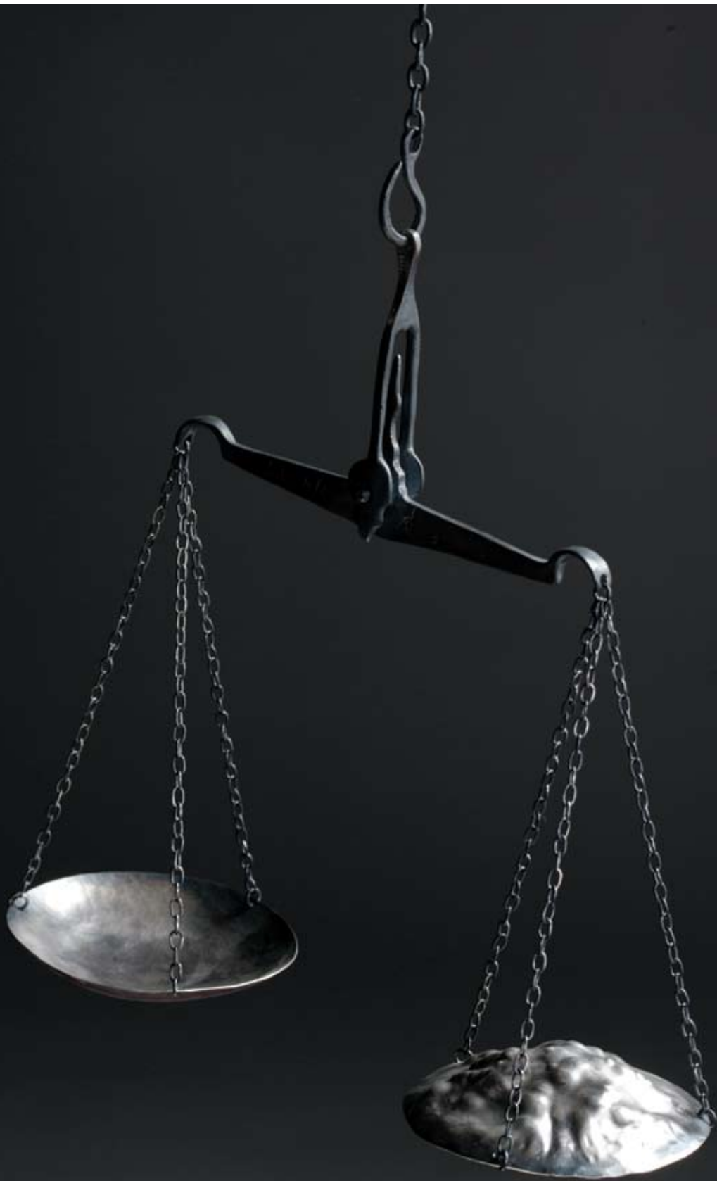
סיגלית לונדאן, "מאזני אי-צדק", 2009, כסף, 22x7x32 ס"מ